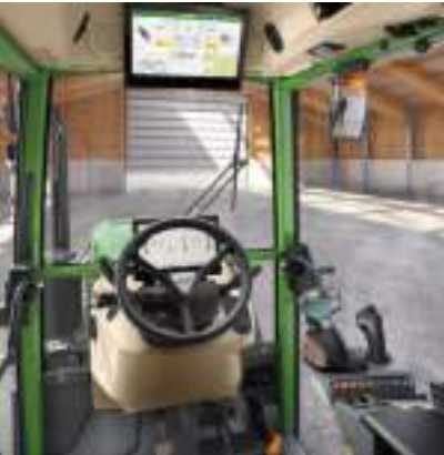
Profi+ Setting 2