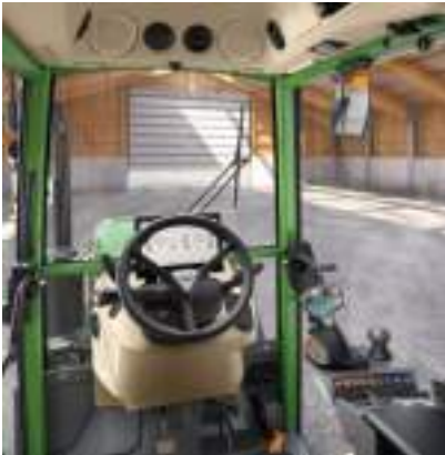
Power Setting 2