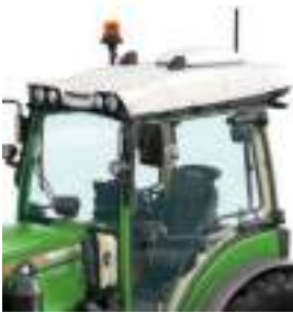
Il ricevitore Fendt Guide è ben protetto e integrato nel tetto.