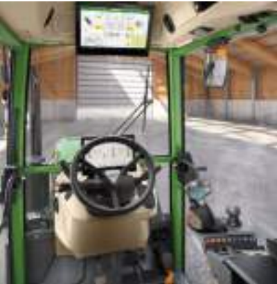
Profi+ Setting 1