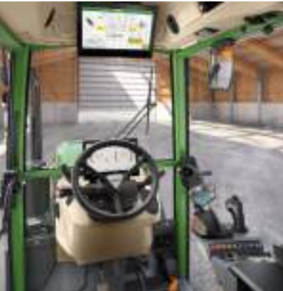
Profi Setting 2