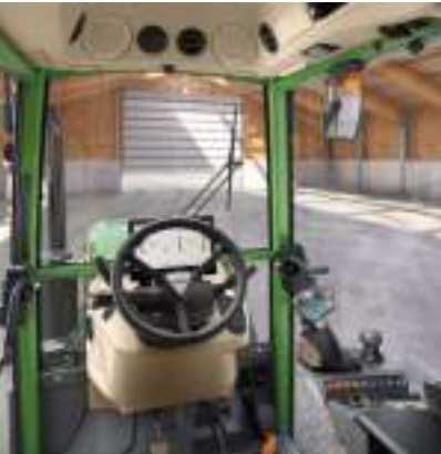
Profi Setting 1

È possibile scegliere tra 2 diverse impostazioni per ciascuna variante di equipaggiamento. Le immagini mostrano le diverse versioni con gli accessori a richiesta.